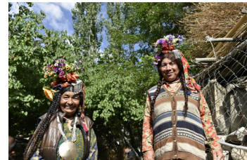
〈라다크 다하누마을 아리안족〉 〈카라동라(5,603M) 정상에서 바라본 라다크〉